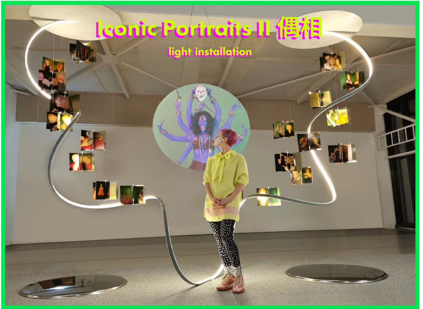
ICONIC PORTRAITS I+II Photographien - Lichtinstallation von Johanna Keimeyer